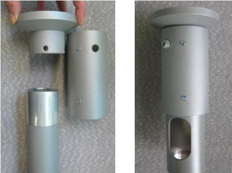
Decke mit Verbindungshülse